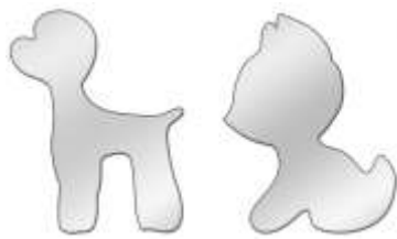
Рис.2. Шаблоны из тонколистового металла

10. Впишите названия инструментов, необходимых для изготовления шаблонов из тонколистового металла, представленных на рисунке 2 (не менее 4-х).